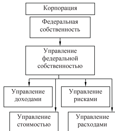
Рис. 2. Экономические аспекты управления федеральной собственностью

Для организации процессов управления принципиально важно согласовать юридическое понятие собственности с ее организационным строением, а также рассмотреть экономические аспекты управления федеральной собственностью (рис. 2). С этой точки зрения необходимо выделить понятие "объект собственности", который следует рассматривать как точку приложения различных управляющих воздействий. В этом случае объектом федеральной собственности является организационно-обособленная часть национального богатства, юридически закрепленная за конкретной группой собственников (корпорацией).