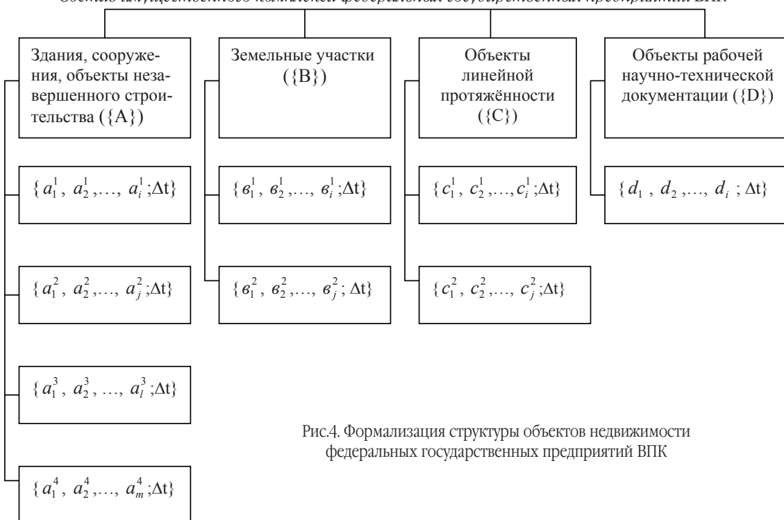
Рис.4. Формализация структуры объектов недвижимости федеральных государственных предприятий ВПК